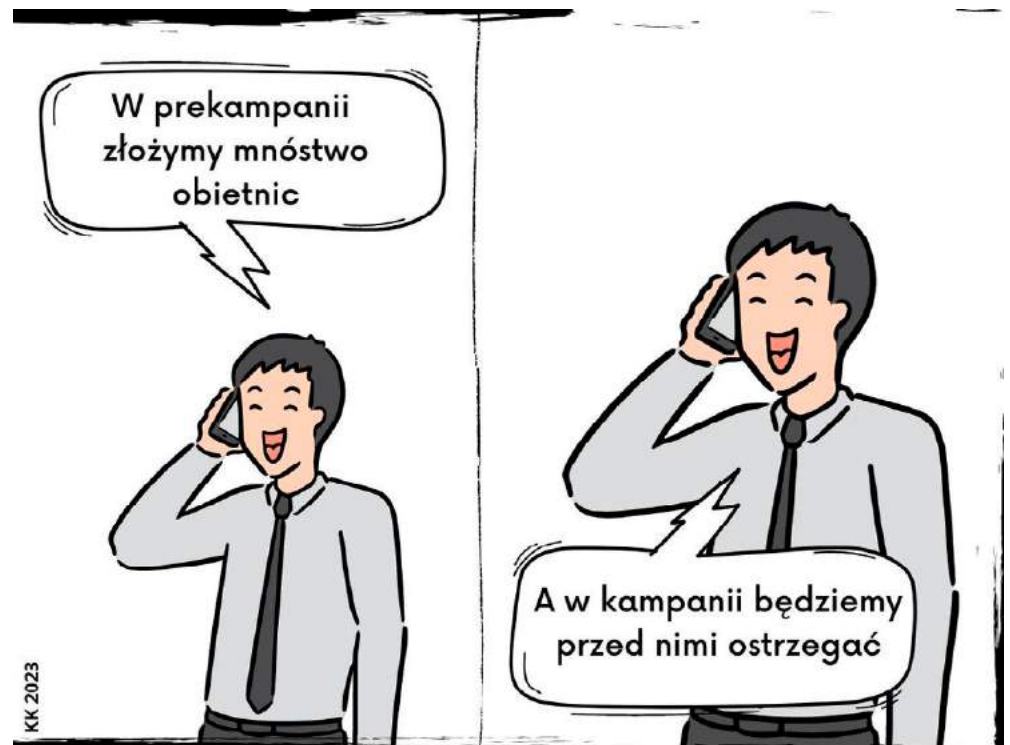
K. Kowalewicz / facebook.com/kowalrysuje

I pamiętajcie, że macie jeszcze czas. Wybory dopiero w październiku. Do tego czasu na pewno znajdziecie swojego kandydata. A jeśli nie, zawsze zostaje opcja „głosu niezadowolonia”. ☑