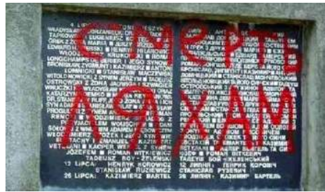
Pięć lat przed wojną rosyjsko ukraińską „piewcy czystek Ukrainy” w „patriotycznym, bo ukraińskim uniesieniu” czerwoną farbą napisali „Śmierć Lachom”. W ten sposób sprofanowany został w nocy z 9 na 10 maja 2009 r. pomnik polskich profesorów we Lwowie, zamordowanych przez Niemców. Licencja Wikimedia CC-BY-SA-3.0

Ów „Dekalog” wcielany był w życie przez dowództwo OUN-B (Prowid) z całą stanowczością. Od wybuchu II wojny światowej obecni bohaterowie Ukrainy, w blasku których wychowuje się kolejne pokolenia młodych Ukraińców, aprobowali fakt „powstania” przeciw polskim mieszkańcom Wołynia i całej Galicji Wschodniej. Wielu twier-