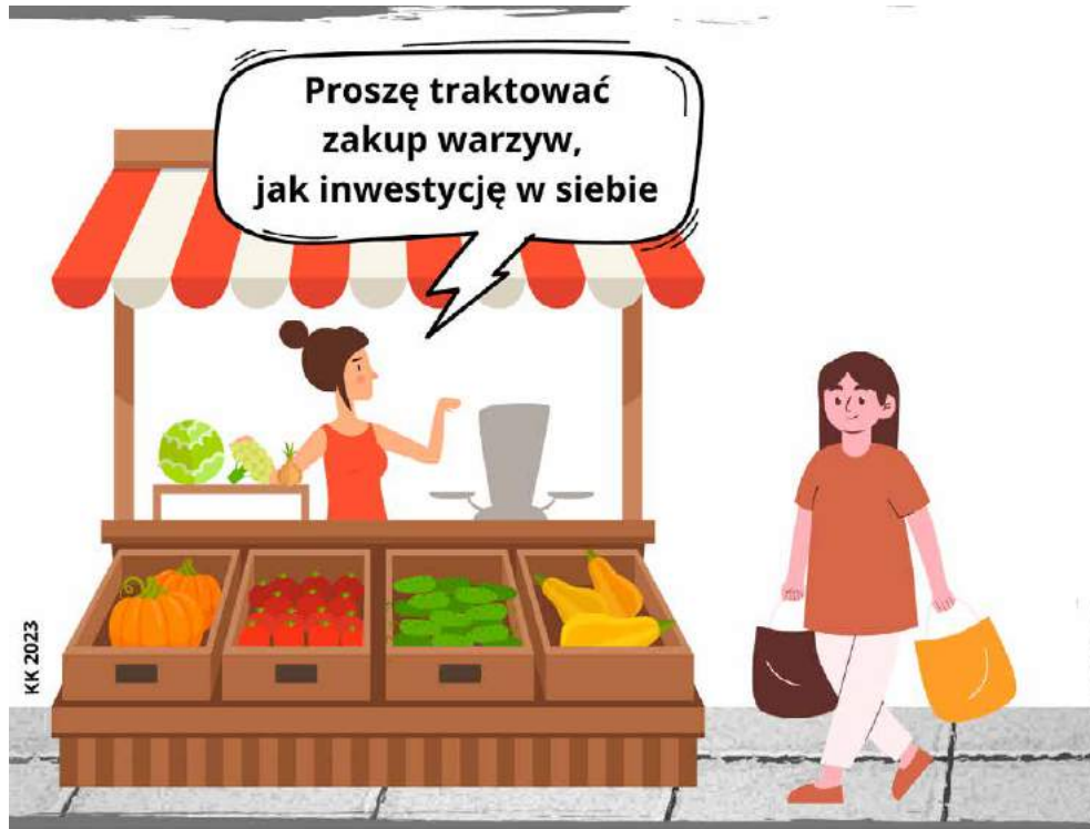
K. Kowalewicz / facebook.com/kowalrysuje