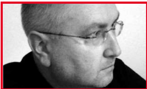
PIOTR SŁOTWIŃSKI www.piotrslotwinski.com