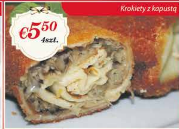
Krokiety z kapustą