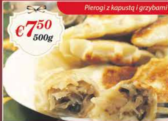
Pierogi z kapustą i grzybami