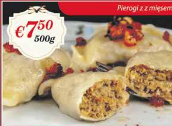
Pierogi z z mięsem