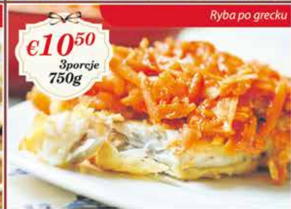
Ryba po grecku