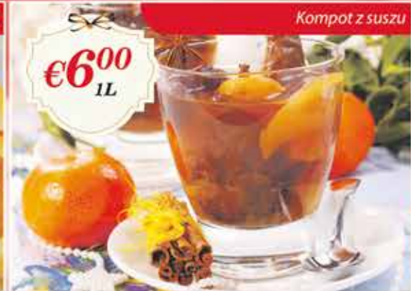
Kompot z suszu