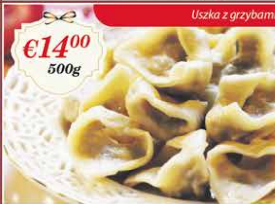
Uszka z grzybami