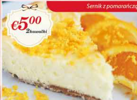
Sernik z pomarańczą