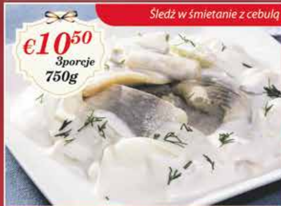
Sledź w śmietanie z cebulą

PRZYJMUJEMY ZAMÓWIENIA NA POTRAWY ŚWIĄTECZNE Zamówienia oraz odbiór możliwy będzie w restauracji Comix. Opłaty należy dokonać z góry. ZAMÓWIENIA PROSIMY SKŁADAĆ DO 17 GRUDNIA 2016R Odbiór dostępny w dniach między 23 a 24 grudnia.