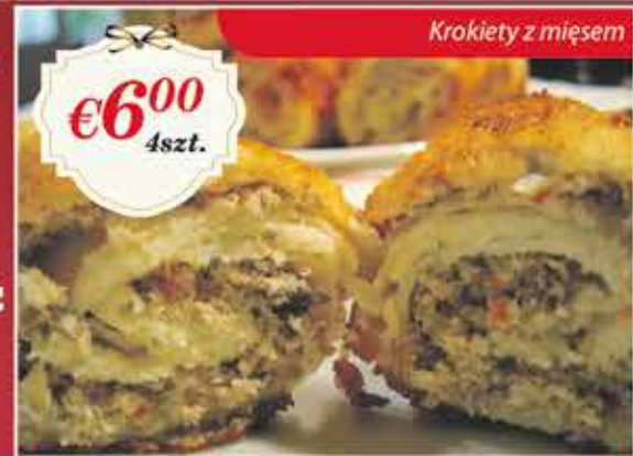
Krokiety z mięsem

PRZYJMUJEMY ZAMÓWIENIA NA POTRAWY ŚWIĄTECZNE Zamówienia oraz odbiór możliwy będzie w restauracji Comix. Opłaty należy dokonać z góry. ZAMÓWIENIA PROSIMY SKŁADAĆ DO 17 GRUDNIA 2016R Odbiór dostępny w dniach między 23 a 24 grudnia.