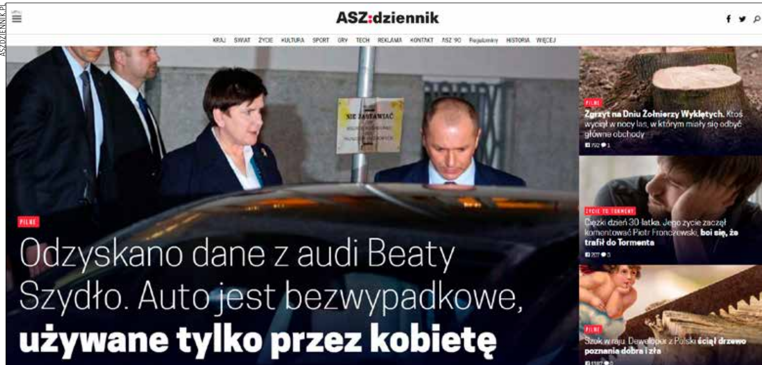
Aszdziennik.pl to portal ze zmyślonymi newsami

Najbardziej widoczne przykłady fałszywych wiadomości, czy pisanych dla żartu czy rozpowszechnianych w celu zwalczania przeciwnika, mieliśmy okazję oglądać najpierw przed referendum decydującym o Brexicie, a potem podczas kampanii prezydenckiej w Stanach Zjednoczonych. I bez względu, po